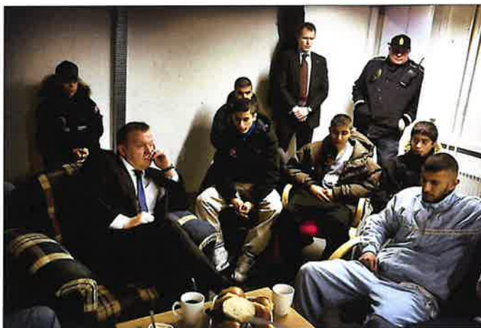
Besøg af daværende statsminister Lars Løkke Rasmussen i kælderens under Stamhuset. Billedet blev kåret som årets pressefoto 2011.