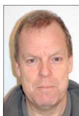
Driftasst.: Brian Olsen