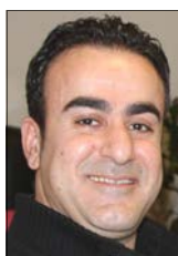
Kurdisk klub Sheirko Mahmood