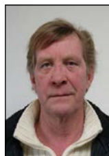
Billardklubben Jon Vestergård