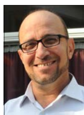
Mens Salon Abdulkareem